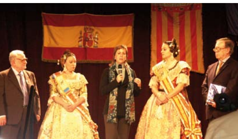
Presentación de las Falleras Mayores de la Casa de Valencia en París.

de la misma. Al día siguiente, sábado 24, en el mismo marco de la exposición y bajo la presidencia de la honorable Consellera de Cooperación y Participación de la Generalitat Valenciana, Gema Amor, tuvo lugar la IIIª Conferencia de Centros Valencianos en Europa.